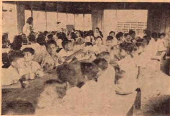
Comedor Infantil en Puerto Cortés.