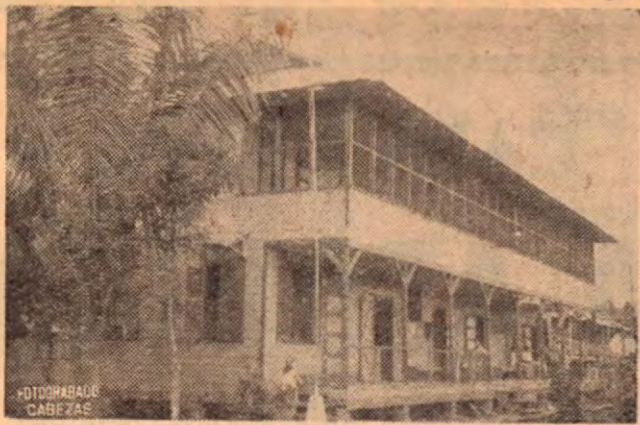
Edificio que sirve de Aduana en Puerto González Víquez. Límite con Panamá.