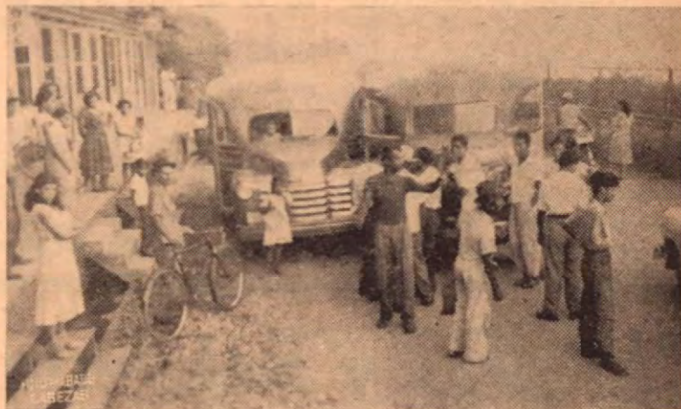
Guerra de autobuses de pasajeros en Golfito.

La única en su estilo en QUEPOS No hay otra. Ni la busque.