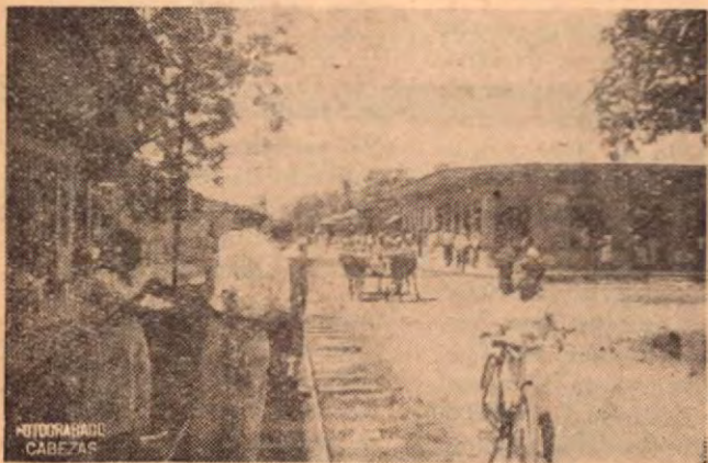
Calle Central y del Comercio de Puerto Cortés.