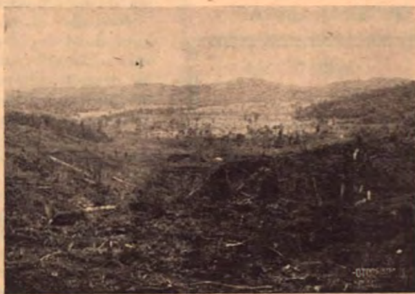
MORAVIA DE CHIRRIPO UN PUEBLO EN MARCHA

Nació en Liberia y su vida es todo un poema de Shakespeare: Boticario, Alcalde, Oficinista que incursiona con los códigos en el brazo por las antecámaras de Alcaldías y Juzgados y es todo poeta. Poeta del amor, del dolor y... Poeta del llano y de la montaña.