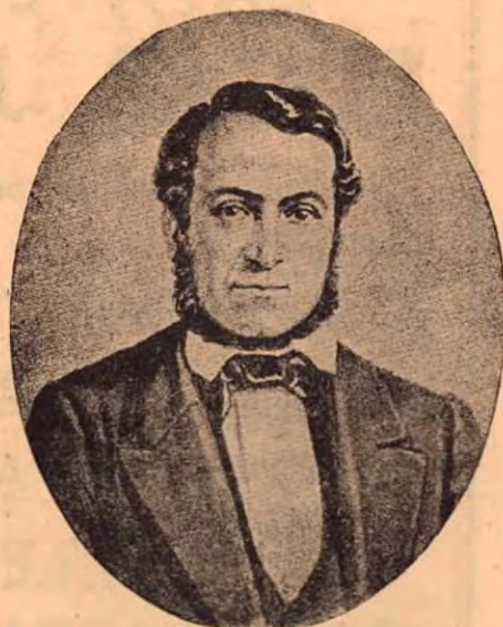
Don Juan Rafael Mora.

En el año de 1860, cuando se desasrollaron los acontecimientos que tristemente recuerda Costa Rica, y que culminaron con la muerte de Mora, Cañas, Arancibia y otros más, lo que es floreciente ciudad de Puntarenas, era un villorrio de pocas casas, un germen de ciudad, que tenía sus construcciones al lado del Estero. El hoy Parque Victoria, era una plaza de sesteo en cuyo centro se levantaba un templete de madera en memoria de la victoria de nuestros armas en los años de 1856 y 1857, dedicado a Don Juanito y al General Cañas, cuyos nombres estaban inscritos sobre una tabla en caracteres negros