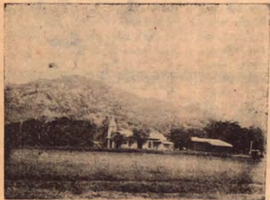
Plazoleta de Las Juntas de Abangares. Al fondo la iglesia y la escuela

Los versos de radiantes esplendores por ELLA surgen de mi lira inquieta, por ELLA siento inspiración y amores, y tan sólo por ELLA soy poeta