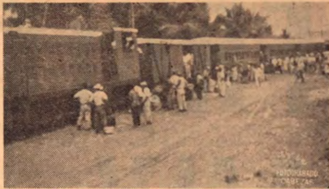
Llegada del tren de Pasajeros de Puerto González Víquez a Golfito.