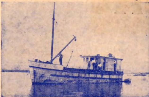
Lancha LA GAVIOTA