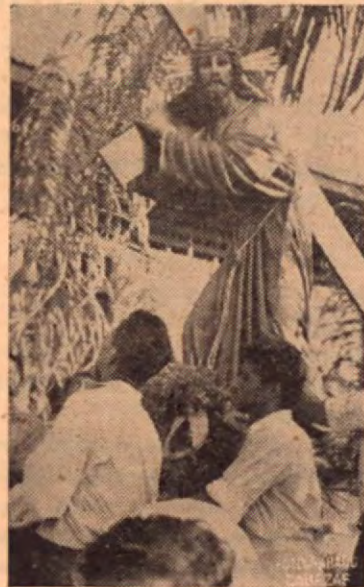
El 9 de marzo corriente, y por contribución pública de todo el

pueblo de Pto. Cortés, fué adquirida para la Iglesia de ese lugar, una bellisima imagen de nuestro Señor Jesus de Nazaret.