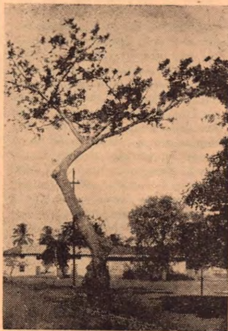
El Jobo Histórico